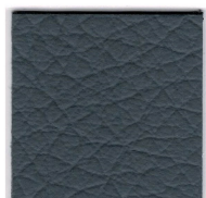
33638 costal blue