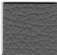
33432 grey 60