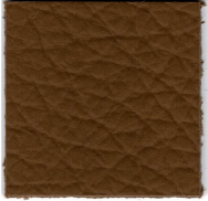
33424 saddle 85C