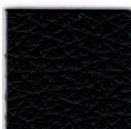
33100 black D