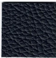
33643 rhapsody blue