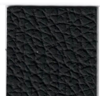
33100 black C