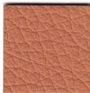
33642 natur tan