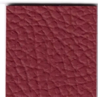
33412 classic red