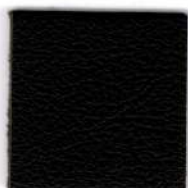
05509 dark brown