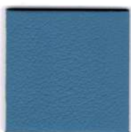
55233 sky blue