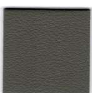
55205 grey brown