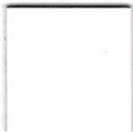
05500 super white