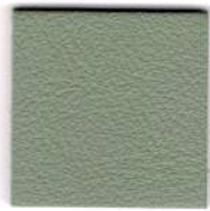
05518 lagoon green